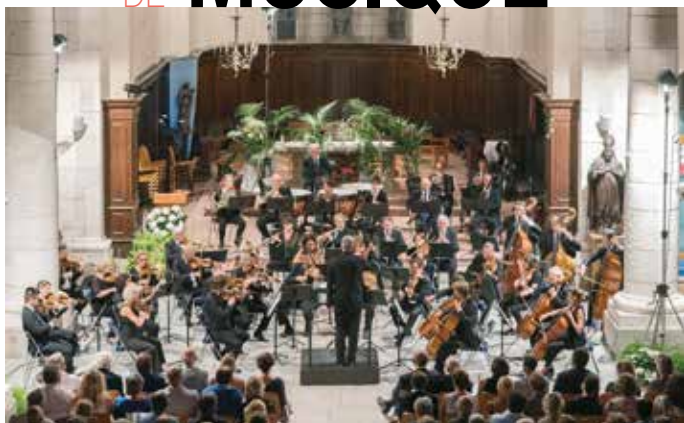
Orchestre de Bretagne