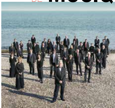
Orchestre de Bretagne