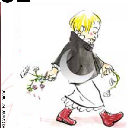
Des Malheurs de Sophie