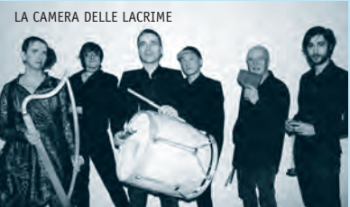
LA CAMERA DELLE LACRIME

tarifs > 28 e / 26 e (réduit) / 10 e (spécial) gratuit pour les –16 ans