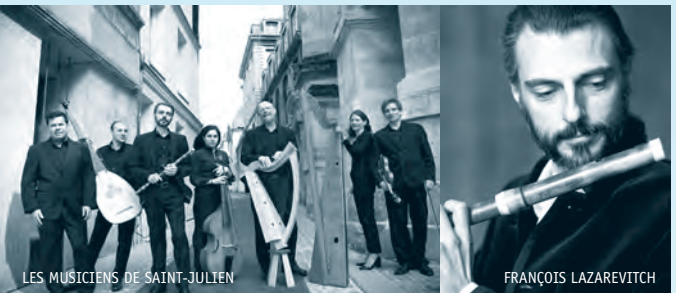
LES MUSICIENS DE SAINT-JULIEN