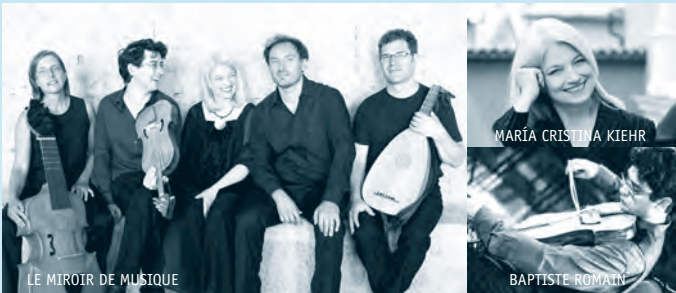
LE MIROIR DE MUSIQUE