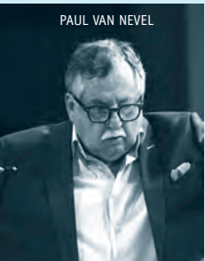
PAUL VAN NEVEL