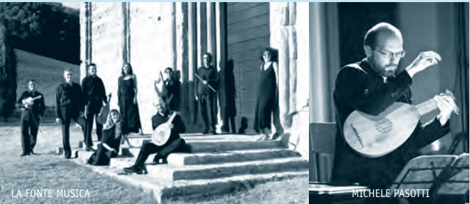
LA FONTE MUSICA